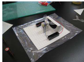
科学の甲子園県大会（H26） 理数科生徒が作製したホバークラフト