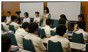
卒業生と語る会（グランシップ勉強会）