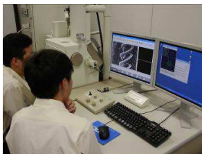
理数研究の様子(2年生)