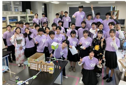
文化祭 ピタゴラ装置づくり 令和4年 2年生