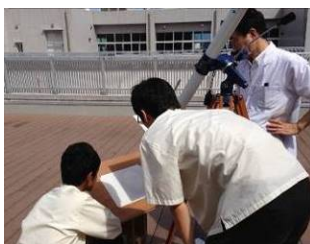
探究活動（太陽黒点の観測）

2年生の 理数探究 では、週に3時間、グループ別に探究活動を行います。皆さんが日ごろ不思議に思っていることを科学的に探究することができます。