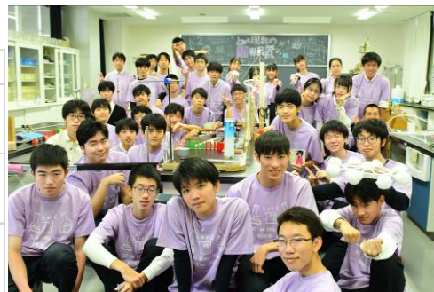
文化祭 ピタゴラ装置づくり 令和5年 2年生