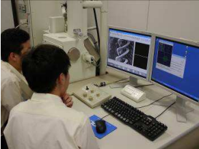
理数探究の様子(2年生)