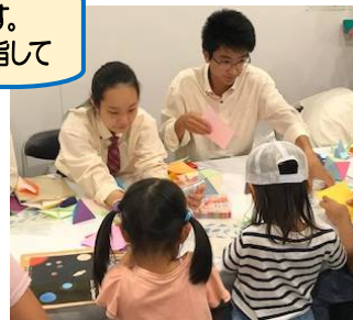
科学の祭典（令和元年 3年生）